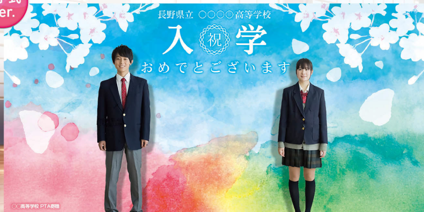
バックパネルSD2250連結タイプ サイズ:W4500×H2250mm