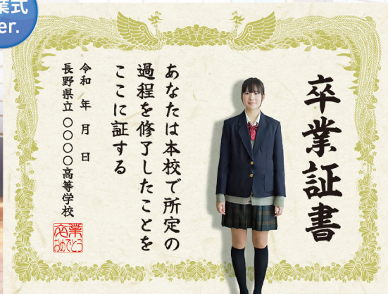
バックパネルSD2980 サイズ:W2980×H2250mm