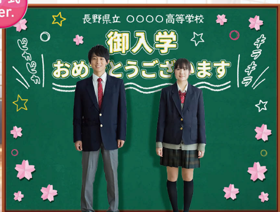
バックパネルSD2980 サイズ:W2980×H2250mm