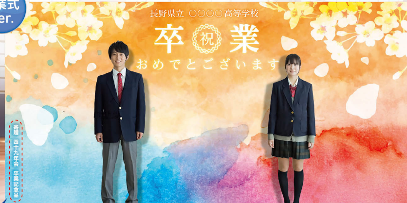
バックパネルSD2250連結タイプ サイズ:W4500×H2250mm